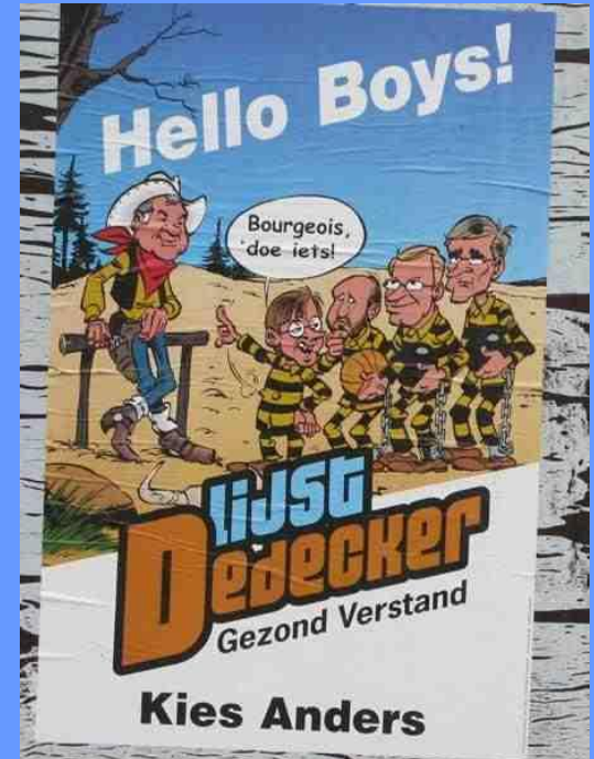
LDD parodie op Lucky Luck en Daltons (2010)