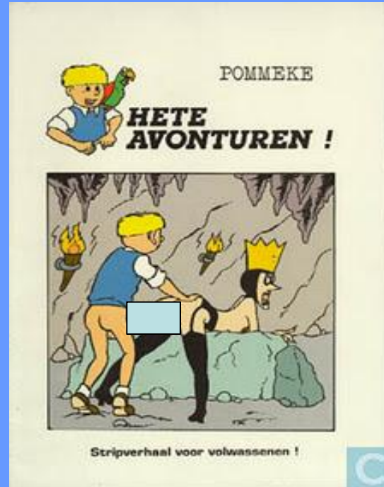
Pommeke parodie op Jommeke (2000)