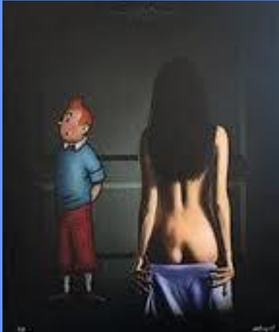
schilderije van Ahlberg (2001)